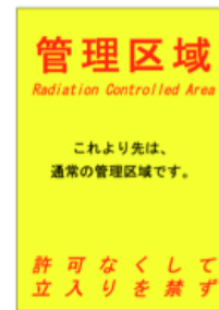
図 3: 注意表示

上記、【特例区域に立入る前に行う安全教育】の事項についてよく理解し遵守して作業します。