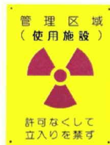
図 2: 管理区域 (使用施設) 標識